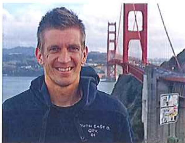
Tennispelaaja Jarkko Nieminen on homofobian vastaisen työn Hyvän tahdon lähettiläs 2014

Kirjoittaja on Sateenkaariyhteisöt ry:n kansainvälisenä homofobian ja transfobian vastaisena päivänä 17.5.2014 nimittämä homofobian vastaisen työn Hyvän tahdon lähettiläs tennispelaaja Jarkko Nieminen.