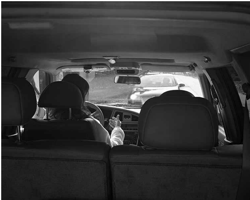
Eric Pickersgill, valokuva sarjasta Removed 'poistettu' (2015)